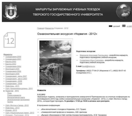
Рис. 1. Страница Интернет-ресурса «Маршруты зарубежных учебных поездок Тверского государственного университета»

В Тверском государственном университете давно и успешно действует система организации, проведения и представления учебных выездных мероприятий.