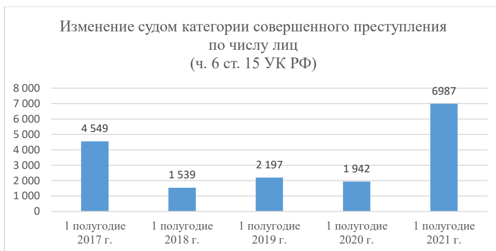
Рис. 1. Динамика изменения судом категории тяжести совершенного преступления (по числу лиц)

Должно быть дано объяснение значений всех кривых, цифр, букв и прочих условных обозначений. В тексте работы даются ссылки на все рисунки в скобках, причем, если ссылка на рисунок идет до рисунка, то в скобках пишем так: (рис. 2). Если же рисунок дополнительно упоминается ниже, то ссылка на него выглядит так: (см. рис. 2).